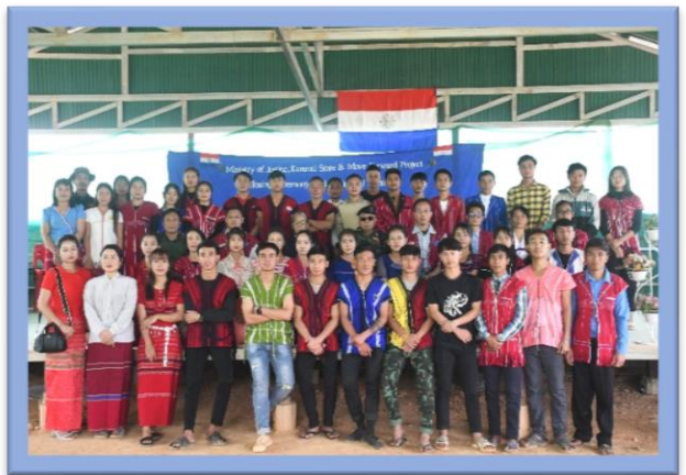
ကရင်နီပြည်အစိုးရ၊ တရားရေးဝန်ကြီးဌာနနှင့် ကရင်နီပြည် ကြားကာလအုပ်ချုပ်ရေးကောင်စီ၊ တရားရေးဌာနတို့ပူးပေါင်း၍ တရားစီရင်ရေးဆိုင်ရာသင်တန်းများ ကျင်းပပြုလုပ်ခဲ့သည့်မှတ်တမ်း