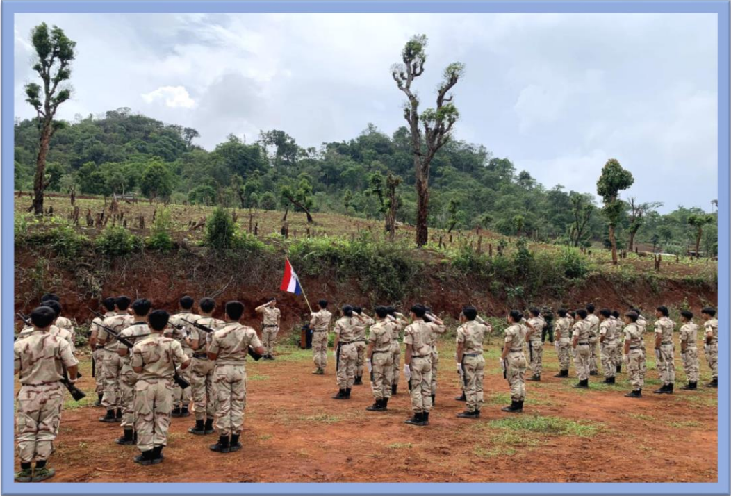
အဓိကရုဏ်းနှိမ်နင်းရေးနှင့် လုံခြုံရေးသင်တန်းပြုလုပ်နေသည့်မှတ်တမ်း

တရားရေးဌာန၊ အကျင့်စာရိတ္တပြုပြင်ရေးနှင့်ပြန်လည်ထူထောင်ရေးရုံး လက်အောက်ရှိ အကျဉ်းထောင်များတွင် တာဝန်ထမ်းဆောင်နေသည့် အကျဉ်းထောင်ဝန်ထမ်းများ၏ ရုံးလုပ်ငန်းနှင့် လုံခြုံရေးဆိုင်ရာ စွမ်းရည်မြှင့်တင်ရေးကိစ္စရပ်များကိုလည်း အလေးထား ဆောင်ရွက်ခဲ့ပါသည်။ အကျဉ်းထောင်အမှတ်(၁)တွင် အဓိကရုဏ်းနှိမ်နင်းရေးနှင့် လုံခြုံရေးသင်တန်းတစ်ရပ်အား ပြုလုပ်ဆောင်ရွက်ခဲ့ပါသည်။