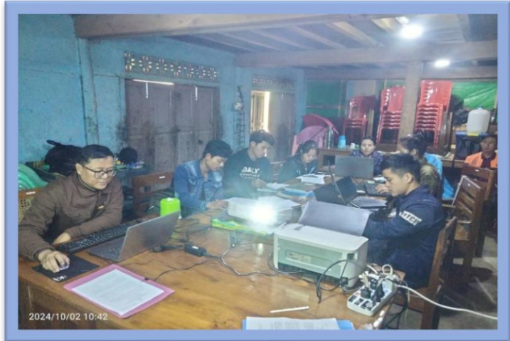
ဝန်ထမ်းစွမ်းရည်မြှင့်သင်တန်း ပြုလုပ်နေသည့်မှတ်တမ်း

တရားရေးဌာနလက်အောက်တွင် တာဝန်ထမ်းဆောင်နေသည့် ရုံးဝန်ထမ်းများနှင့်ပတ်သက်၍ ရုံးစာရေးသားနည်းနှင့်ရုံးလုပ်ငန်းဆိုင်ရာသင်တန်း ပြုလုပ်ဆောင်ရွက်ခဲ့ပါသည်။