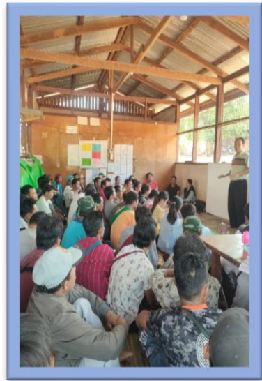
ပြည်သူလူထုနှင့်တွေ့ဆုံ၍ ဥပဒေအသိပညာပေးခြင်းမှတ်တမ်းများ