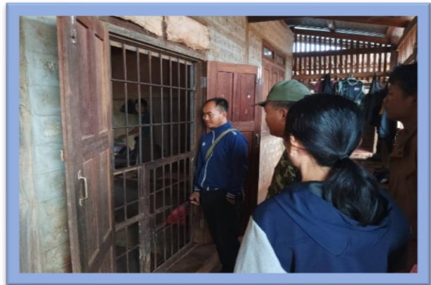
ကရင်နီပြည်ရဲဌာန(KSP)တွင် စစ်ဆေးကြည့်ရှုခြင်း