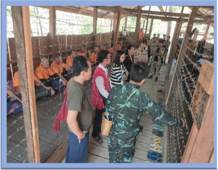
အကျဉ်းထောင်အမှတ်(၁)တွင် စစ်ဆေးကြည့်ရှုခြင်း