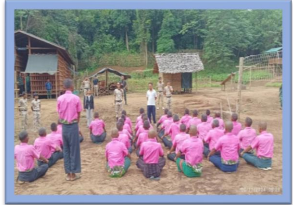
အကျဉ်းထောင်အမှတ်(၂)တွင် စစ်ဆေးကြည့်ရှုခြင်း