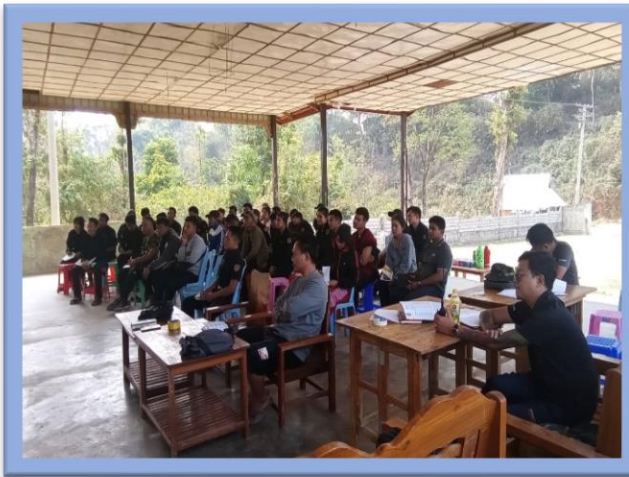
လုပ်ငန်းညှိနှိုင်းအစည်းအဝေးပြုလုပ်သည့် မှတ်တမ်းများ